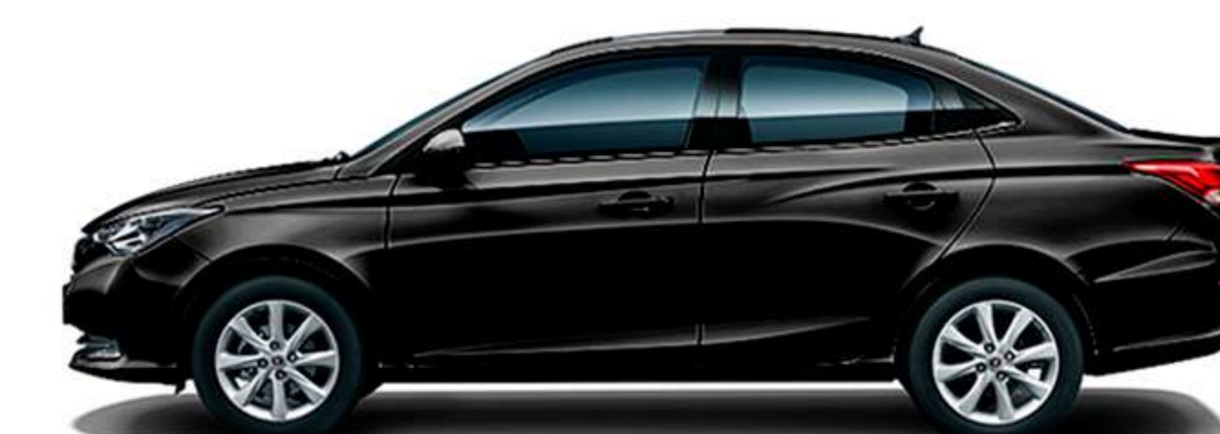
Alto 1,490 mm